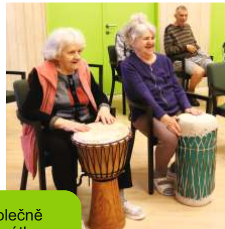
BUBNOVÁNÍ – ke konci dubna jsme si vyzkoušeli novou aktivitu. Společně jsme objevovali svět rytmu, vyzkoušeli si perkusní nástroje irytmičké hrátky s vlastním tělem a nechyběla dobrá atmosféra se zvuky bubnů.